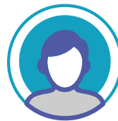
Chargé de mission Contrat Local de Santé (recrutement en cours)