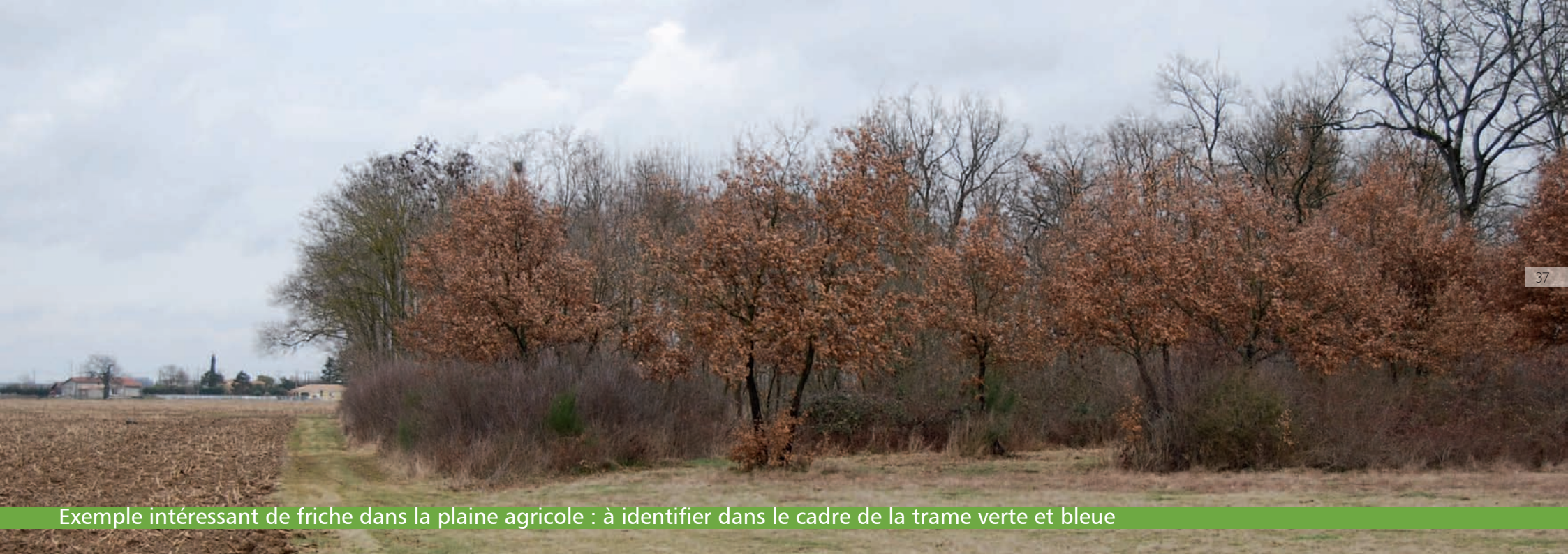
Exemple intéressant de friche dans la plaine agricole : à identifier dans le cadre de la trame verte et bleue