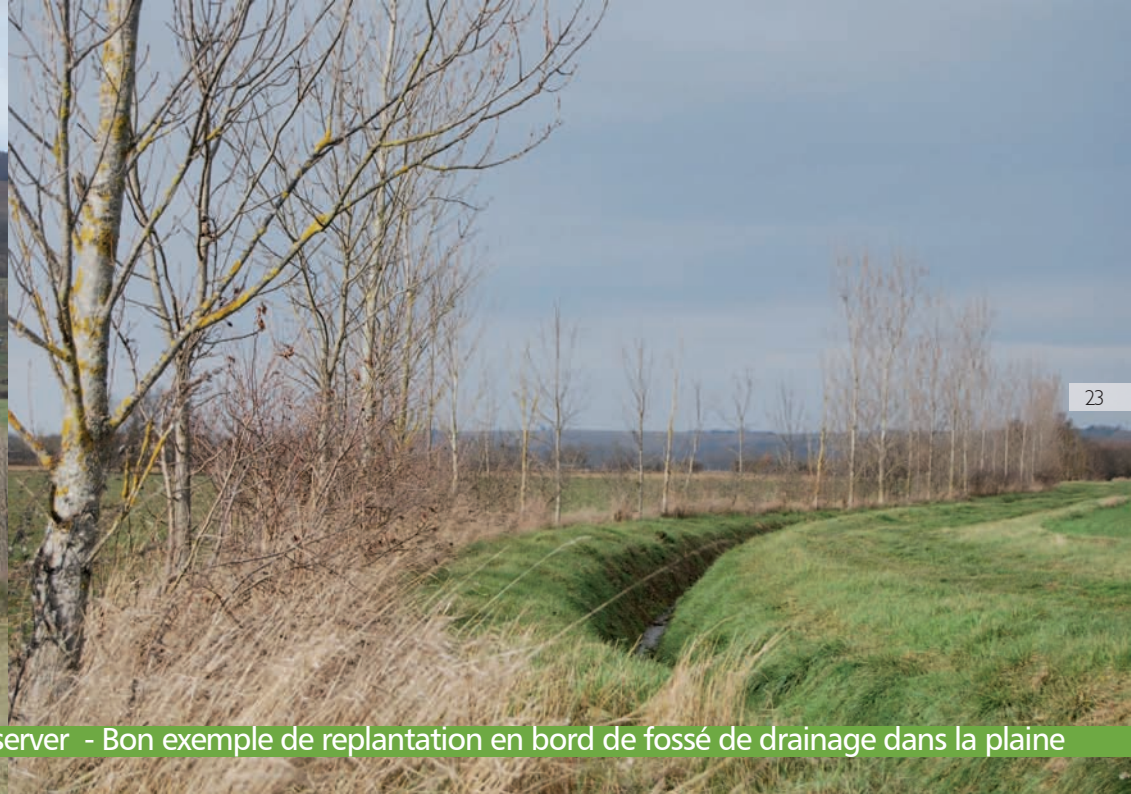
Un beau patrimoine de haies, à identifier aux documents d'urbanisme et à préserver - Bon exemple de replantation en bord de fossé de drainage dans la plaine