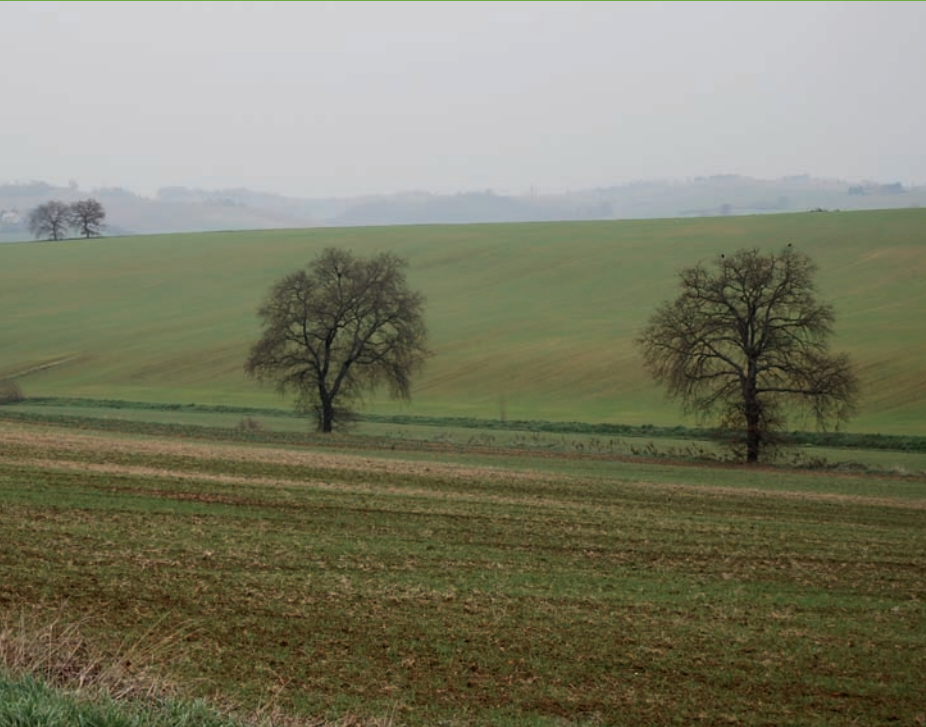
Beaux arbres isolés : à identifier aux documents d'urbanisme et à préserver