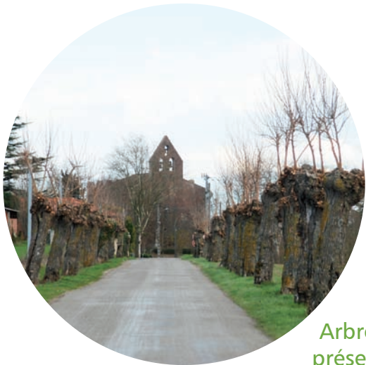
Arbres têtard en entrée de bourg, préservés et gérés