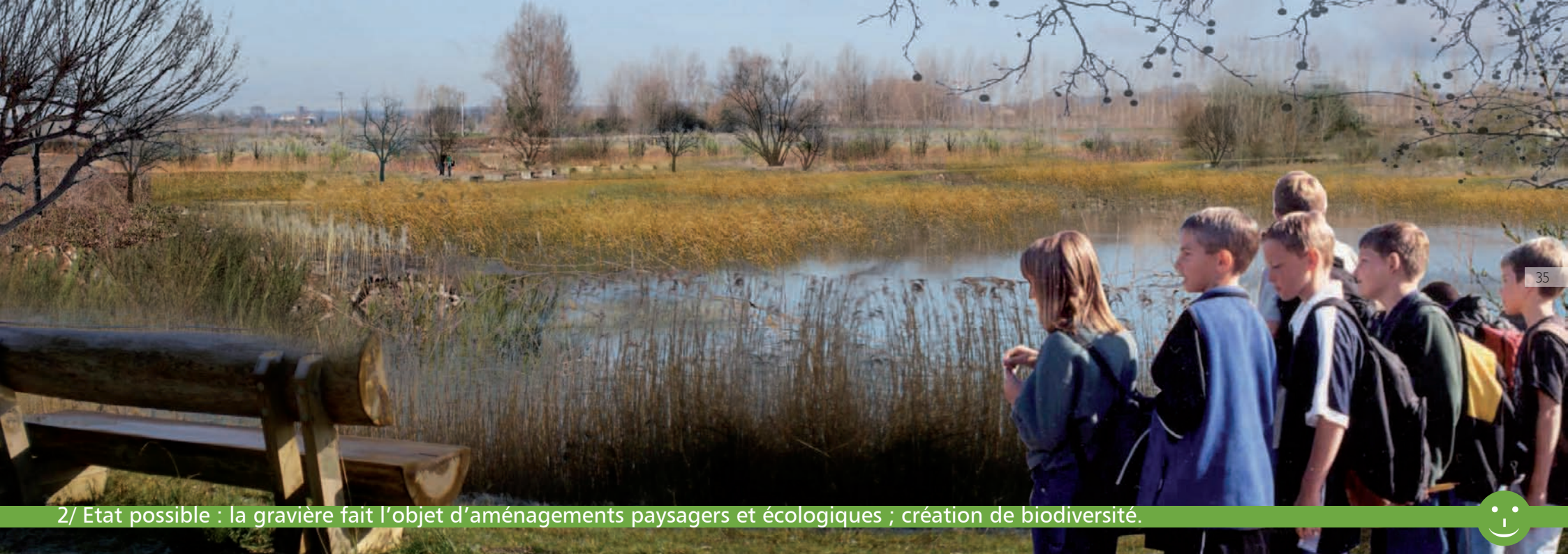
2/ Etat possible : la gravière fait l'objet d'aménagements paysagers et écologiques ; création de biodiversité.