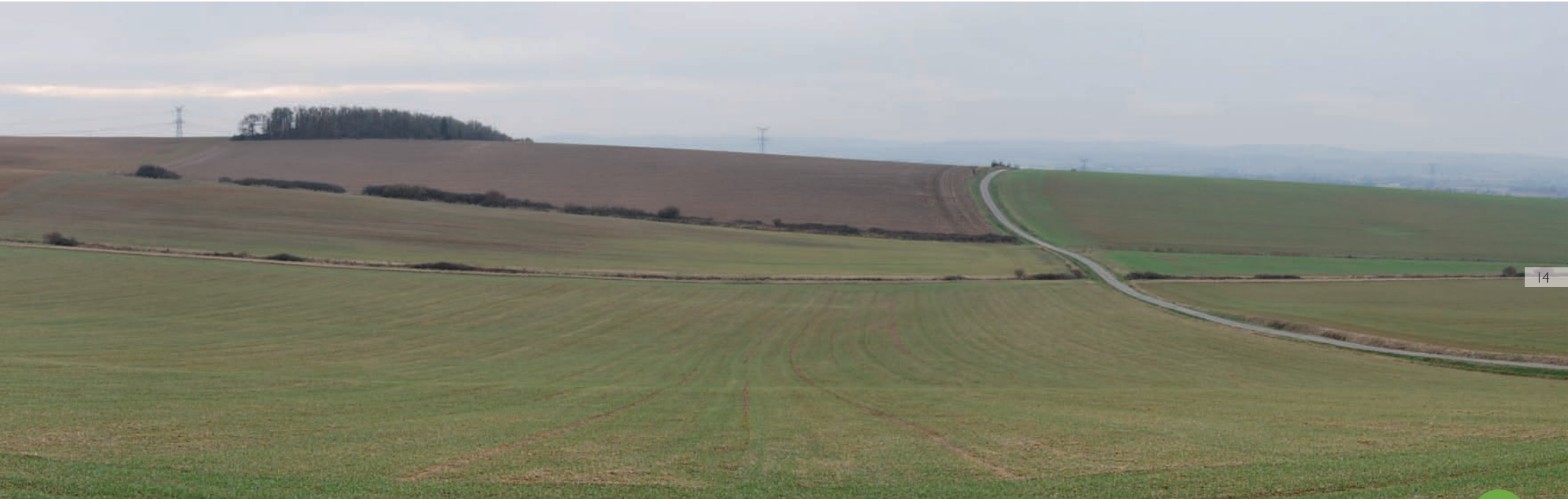
1/ Etat initial : paysage agricole simplifié (disparition des haies, arbres, bosquets et chemins)