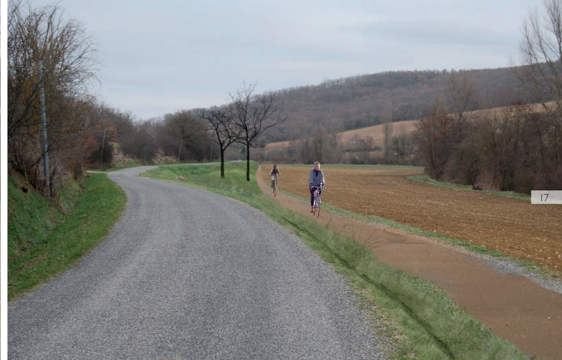
2/ Etat possible : une acquisition de bande de terrain pour une piste cyclable