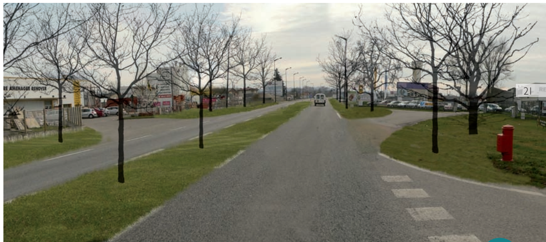
2/ Etat possible : une entrée de ville requalifiée