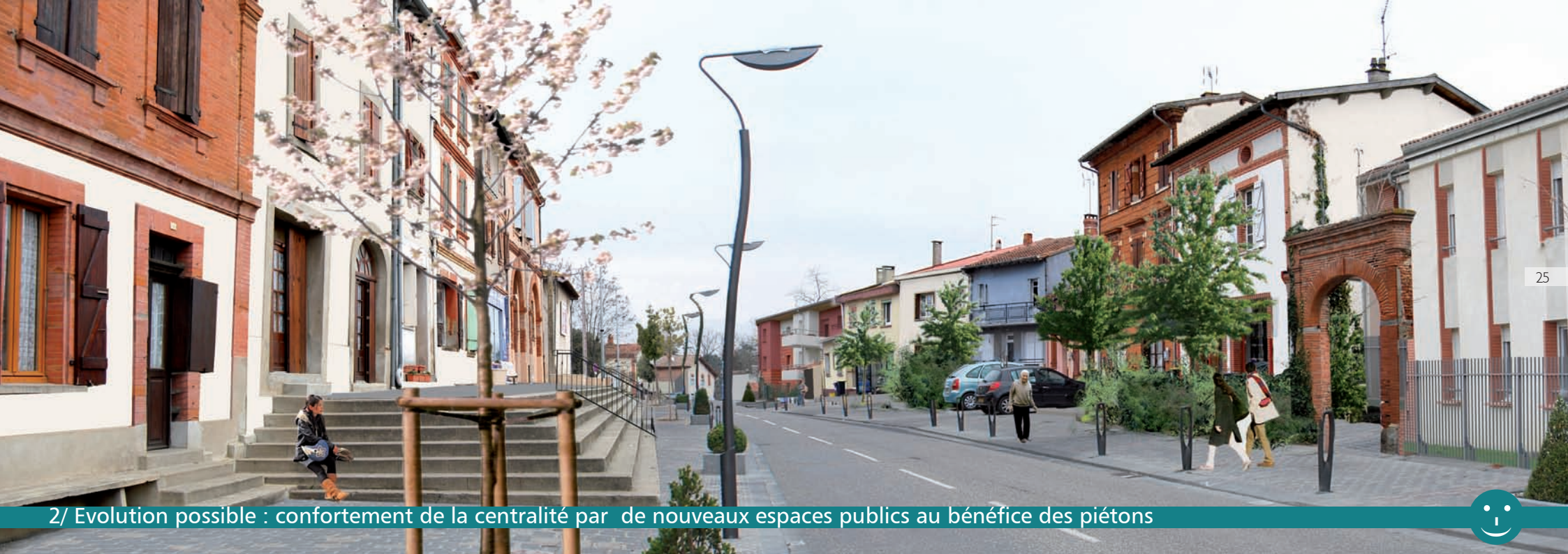
2/ Evolution possible : confortement de la centralité par de nouveaux espaces publics au bénéfice des piétons