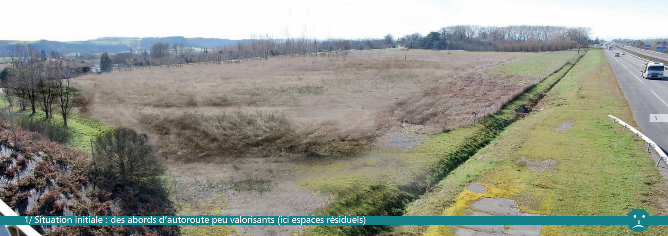
1/ Situation initiale : des abords d'autoroute peu valorisants (ici espaces résiduels)