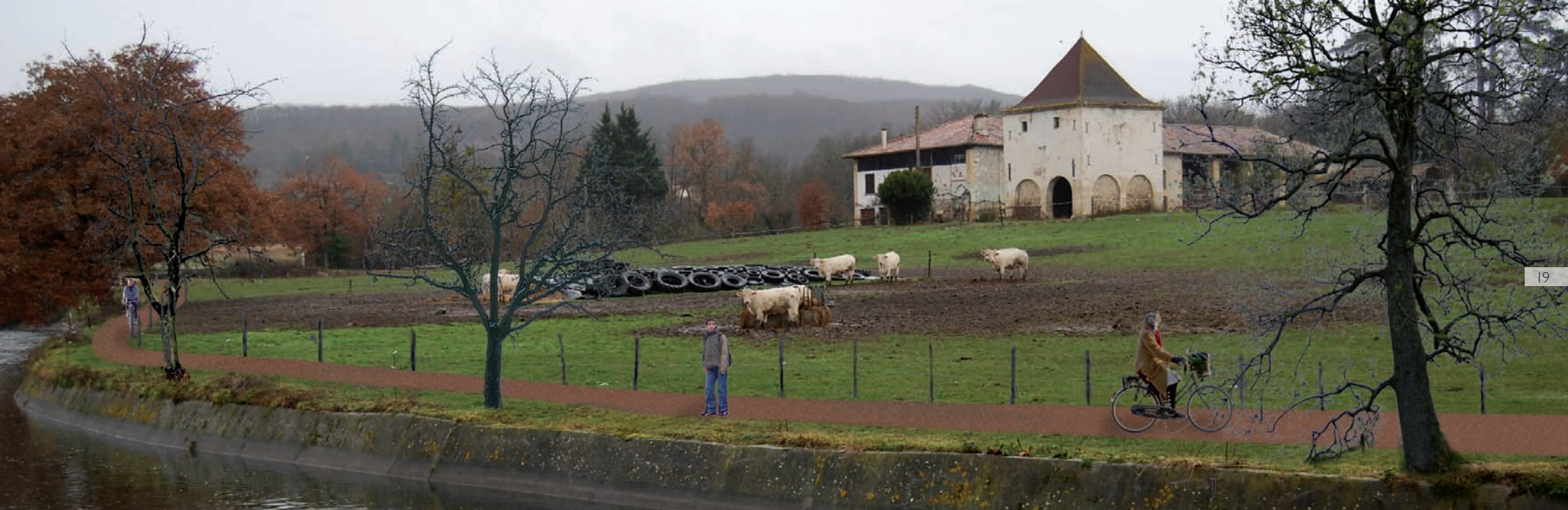
2/ Etat possible : une acquisition de bande de terrain, un aménagement de piste cyclable