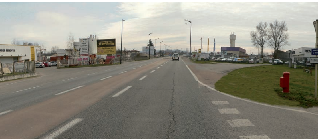
1/ Etat initial : Une entrée de ville dévalorisée