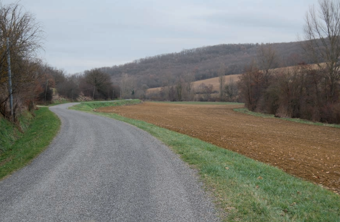
1/ Etat initial : un itinéraire potentiel de circulation douce