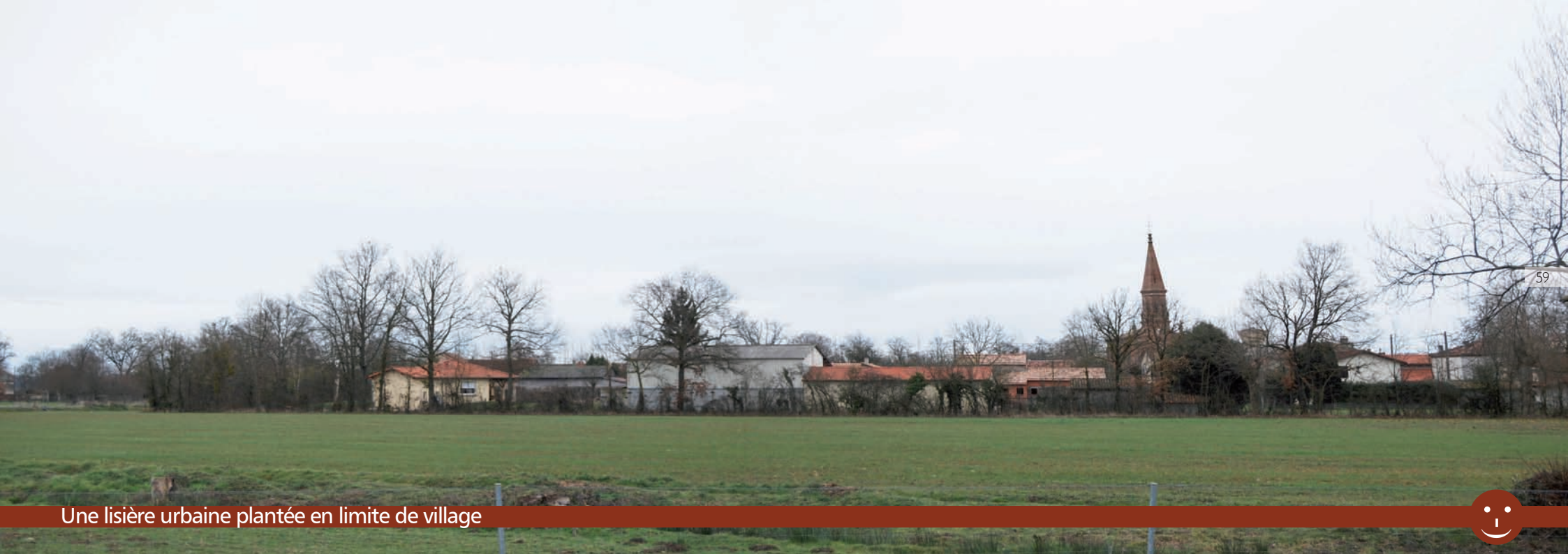
Une lisière urbaine plantée en limite de village