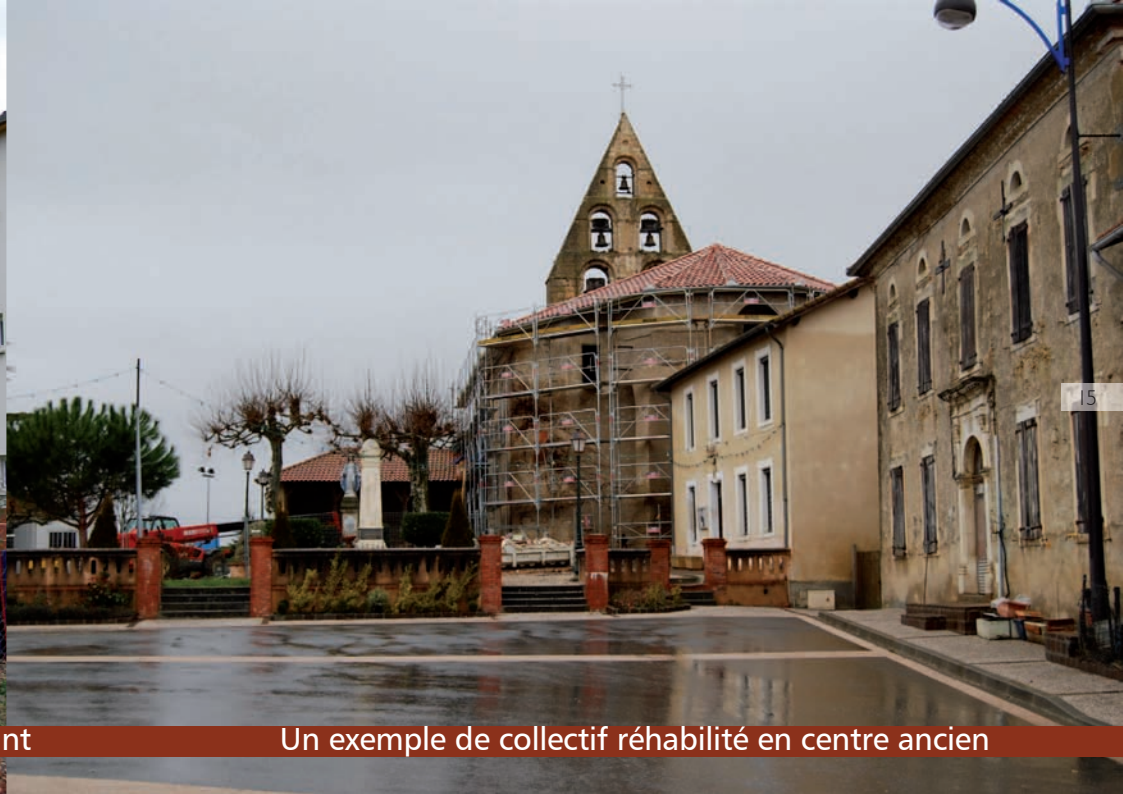
Un exemple de collectif réhabilité en centre ancien