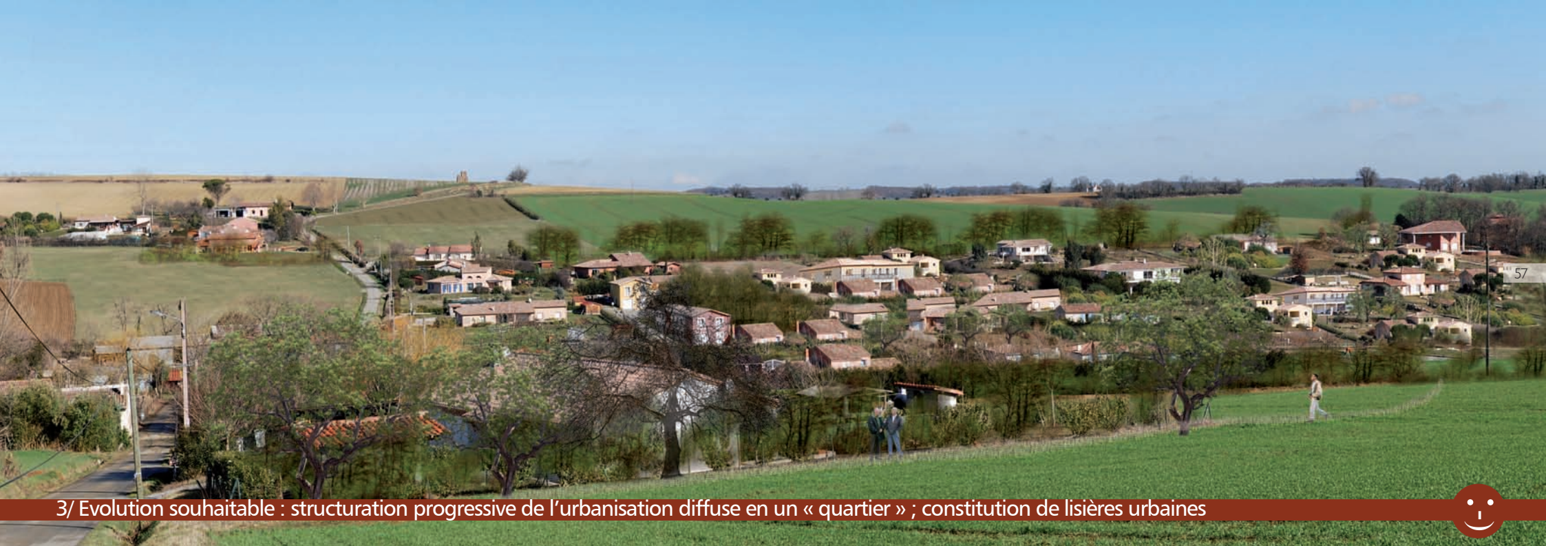
3/ Evolution souhaitable : structuration progressive de l'urbanisation diffuse en un « quartier » ; constitution de lisières urbaines