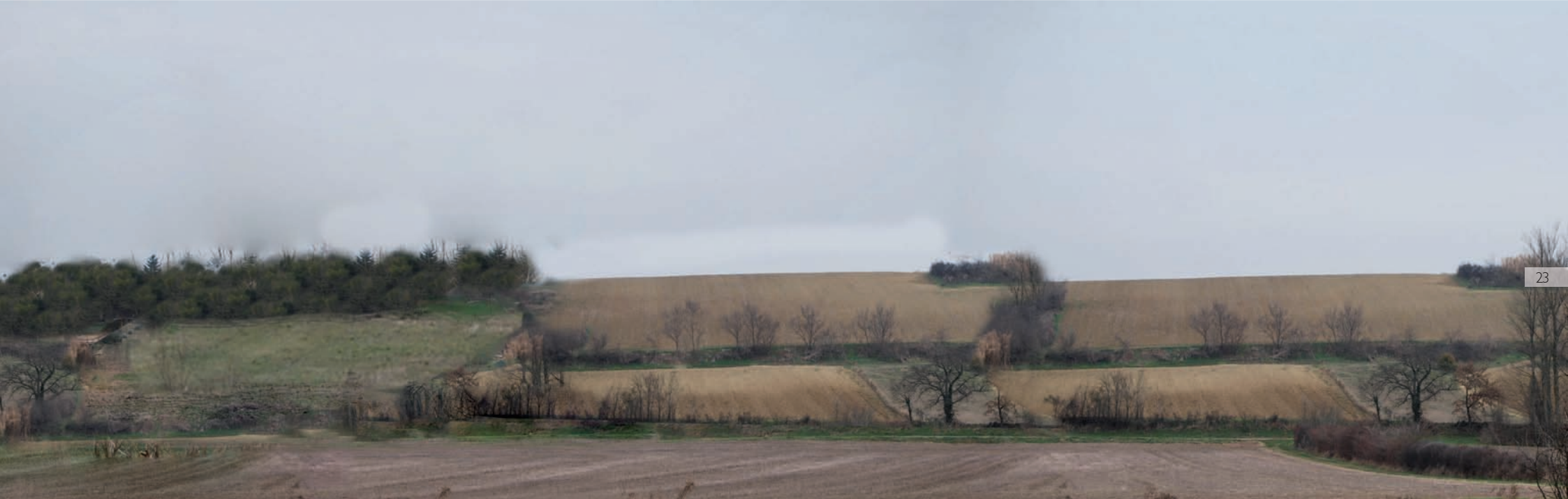
1/ Etat initial : un élégant coteau, valorisé par les structures paysagères créées par l'agriculture : haies arborées et talus