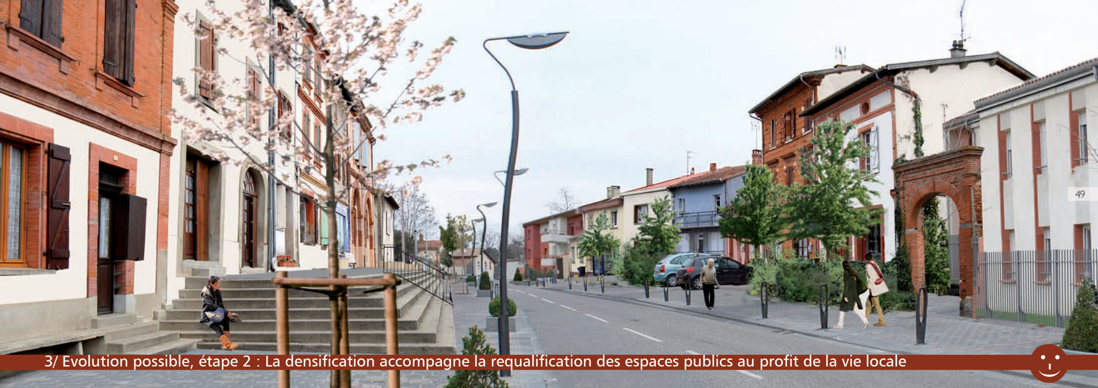
3/ Evolution possible, étape 2 : La densification accompagne la requalification des espaces publics au profit de la vie locale