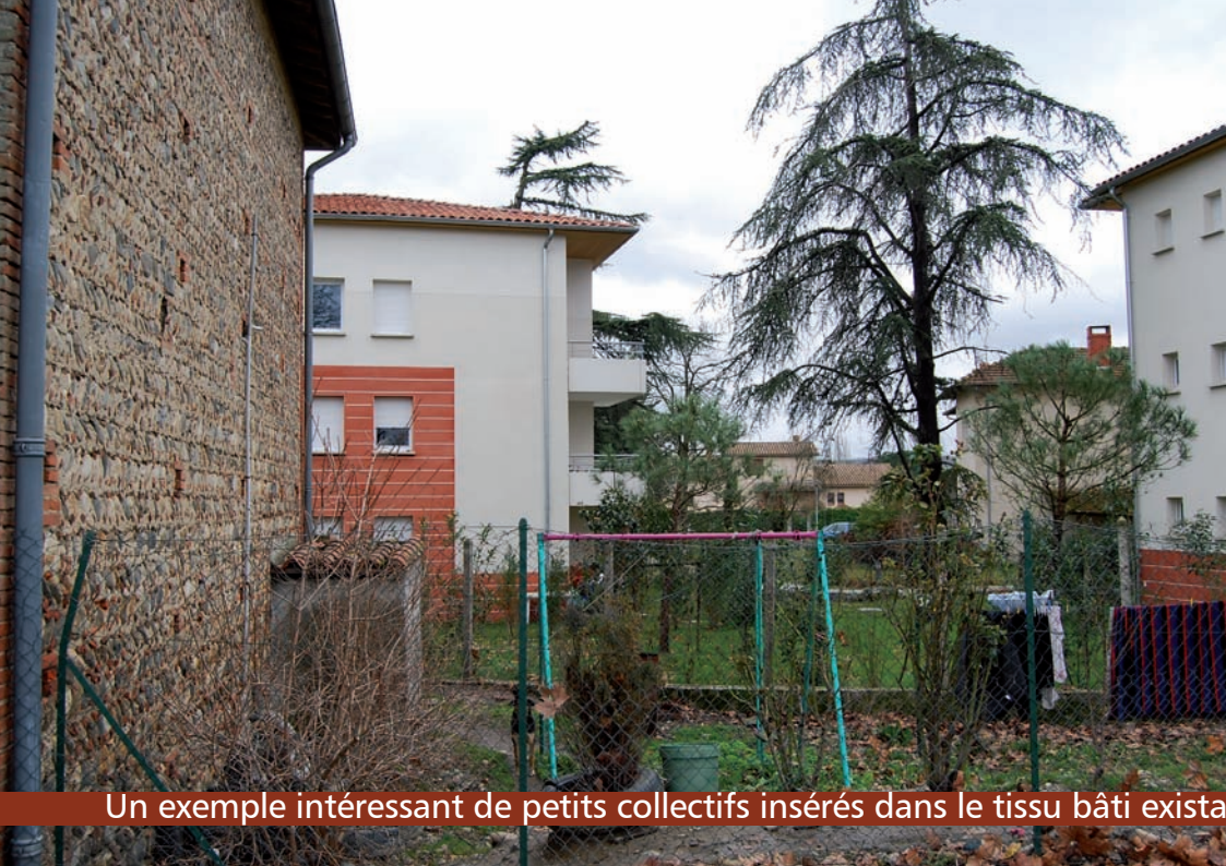
Un exemple intéressant de petits collectifs insérés dans le tissu bâti existant