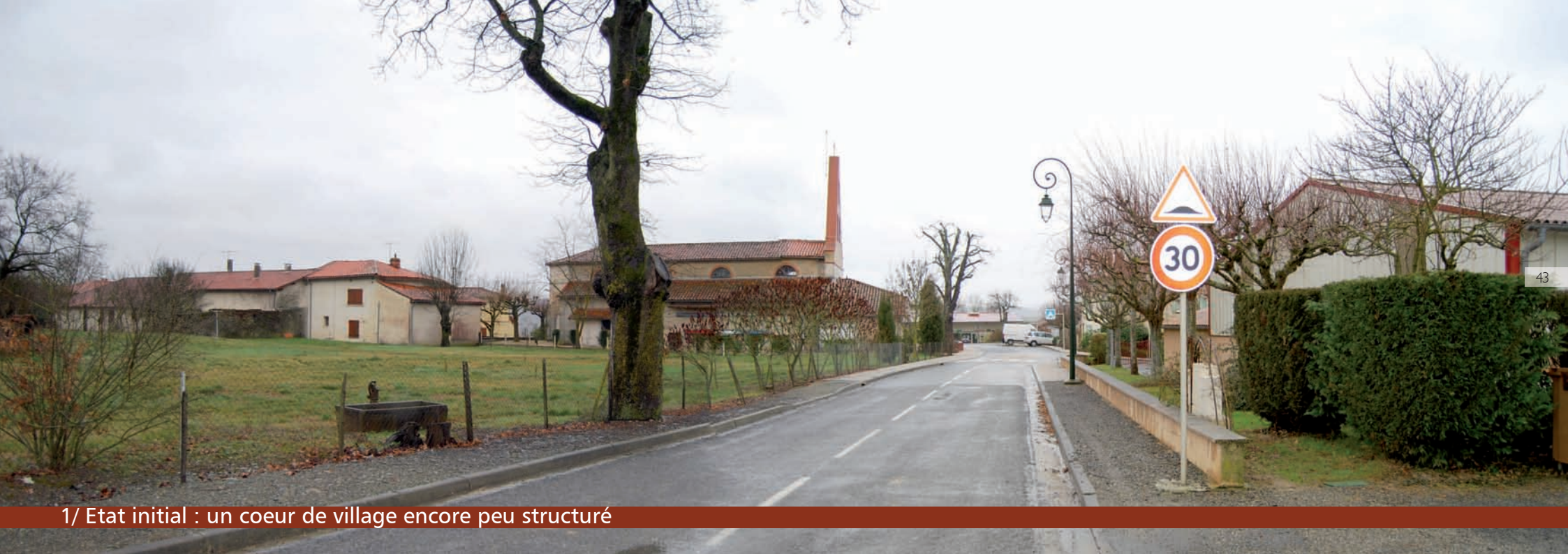
1/ Etat initial : un coeur de village encore peu structuré