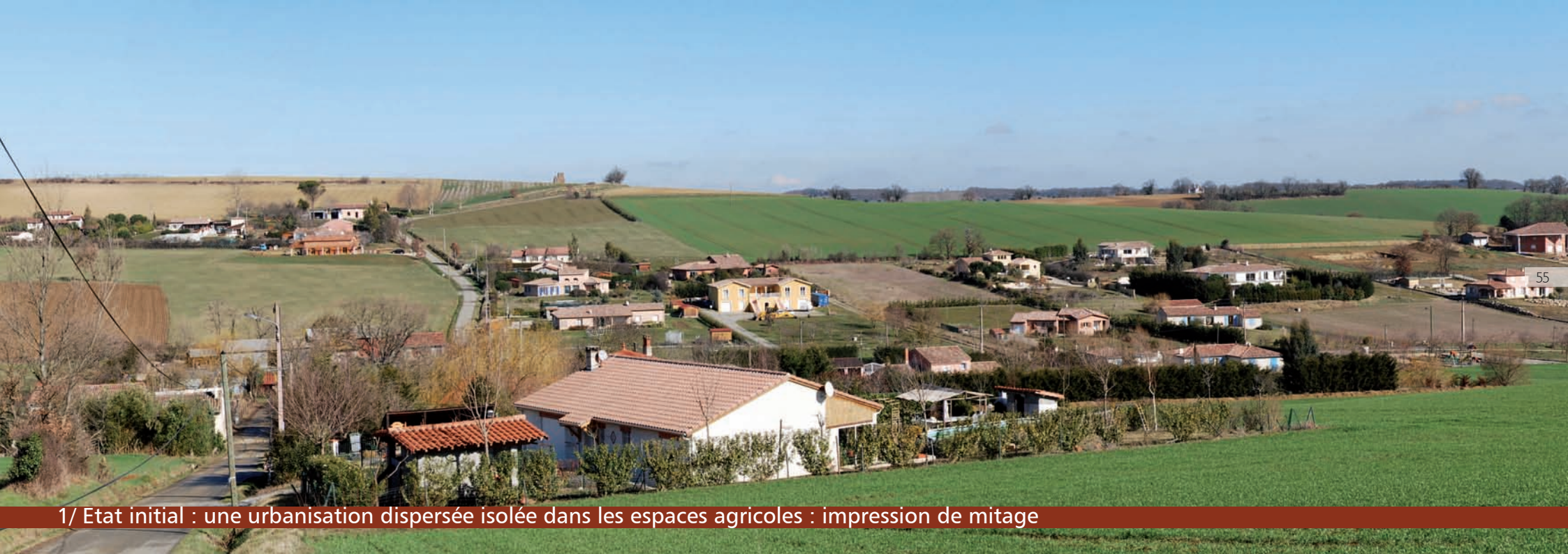
1/ Etat initial : une urbanisation dispersée isolée dans les espaces agricoles : impression de mitage