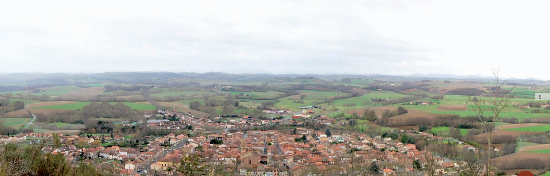
1/ Etat initial : Un centre-ville urbain, clairement délimité dans le paysage