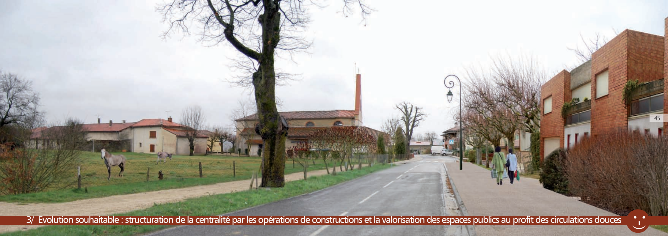
3/ Evolution souhaitable : structuration de la centralité par les opérations de constructions et la valorisation des espaces publics au profit des circulations douces