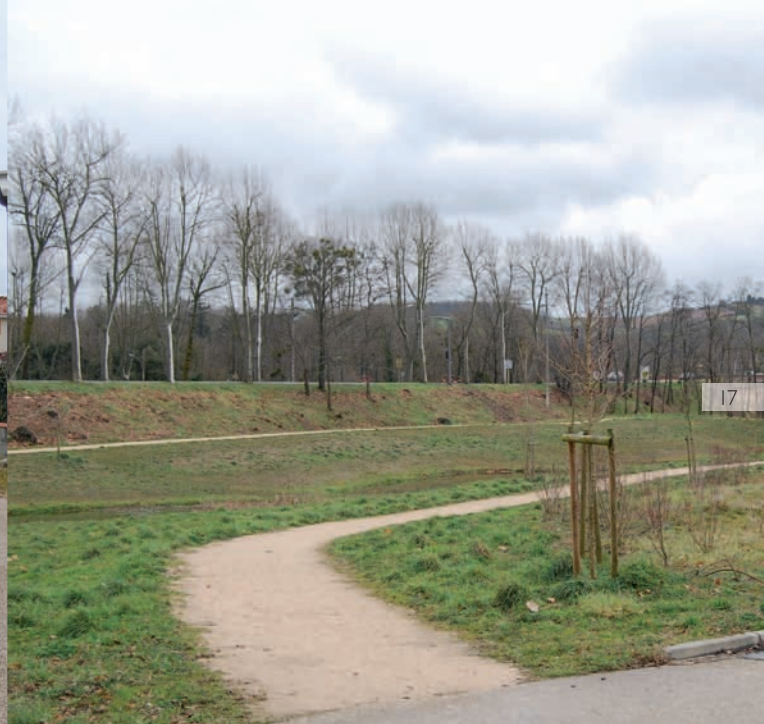
Exemple intéressant de lotissement organisé par les circulations douces