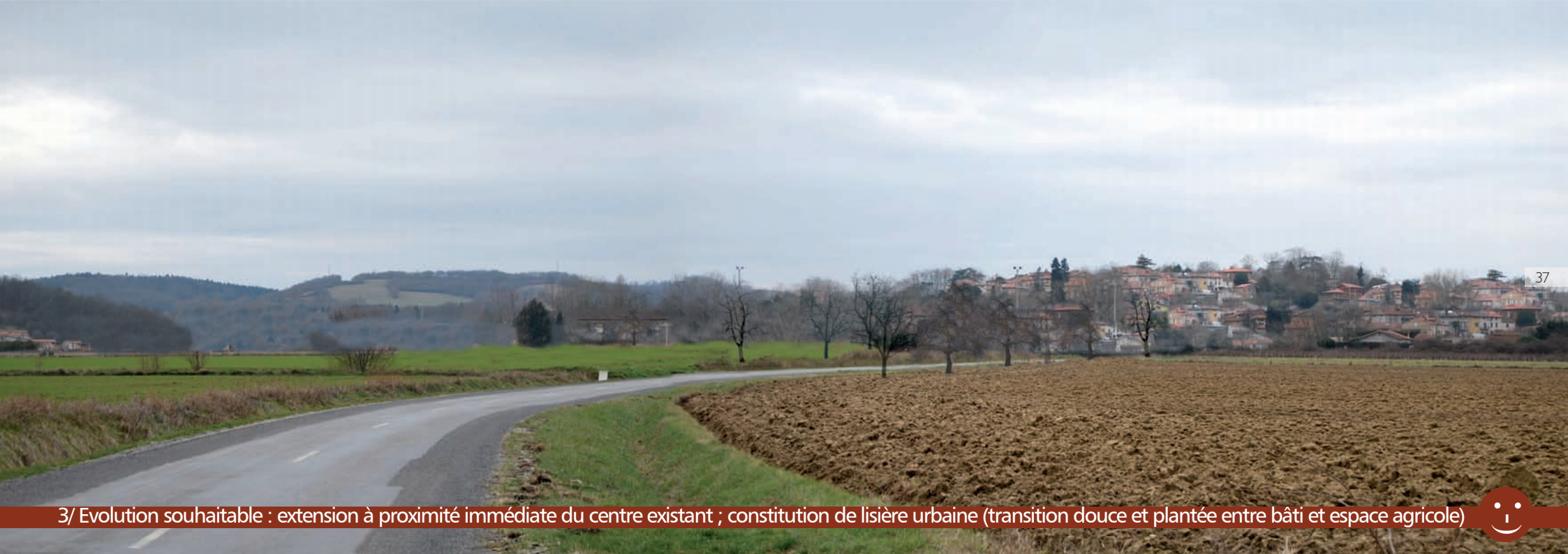
3/ Evolution souhaitable : extension à proximité immédiate du centre existant ; constitution de lisière urbaine (transition douce et plantée entre bâti et espace agricole)