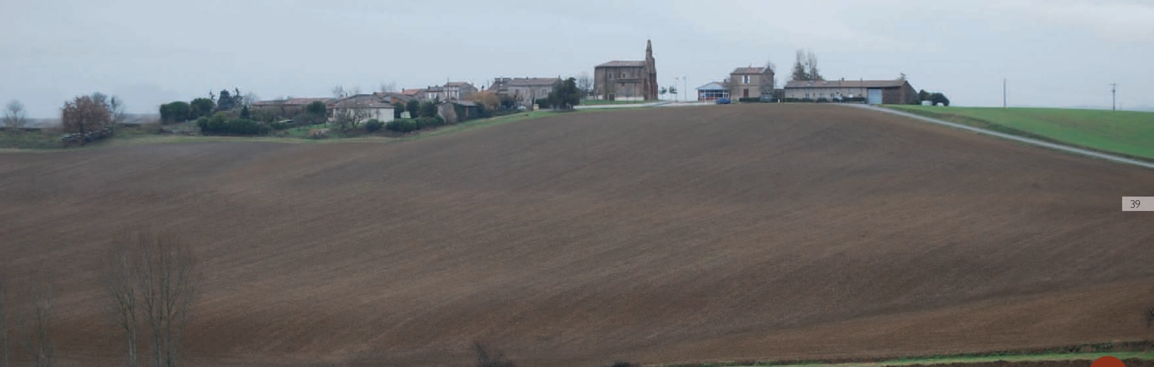
1/ Etat initial : un village encore peu structuré occupant un beau site