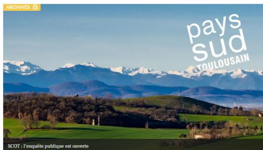
SCOT : l'enquête publique est ouverte