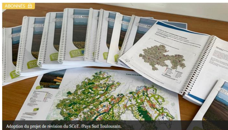
Adoption du projet de révision du SCoT. / Pays Sud Toulousain.