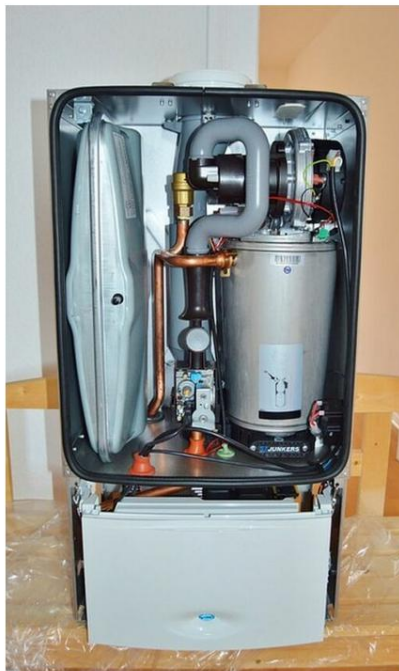
La prime coup de pouce chauffage instaurée par l'Etat aide à financer certains travaux de rénovation énergétique. (illustration)

22 juin 2025 | Jean Besnier | À la une, Environnement, Magazine