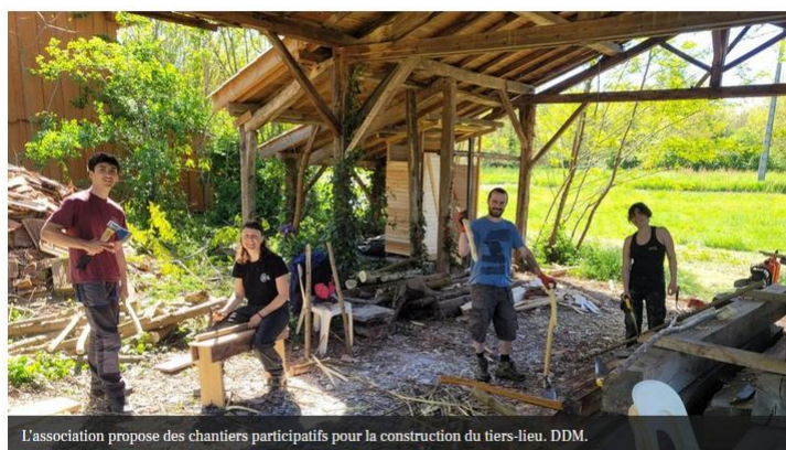
L'association propose des chantiers participatifs pour la construction du tiers-lieu.

Le tiers-lieu Pass'Rêve ouvrira ses portes à Couladère en 2026