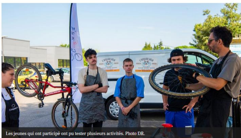
Les jeunes qui ont participé ont pu tester plusieurs activités.

Le Vernet. "En route vers ton avenir" aide les jeunes à s'orienter